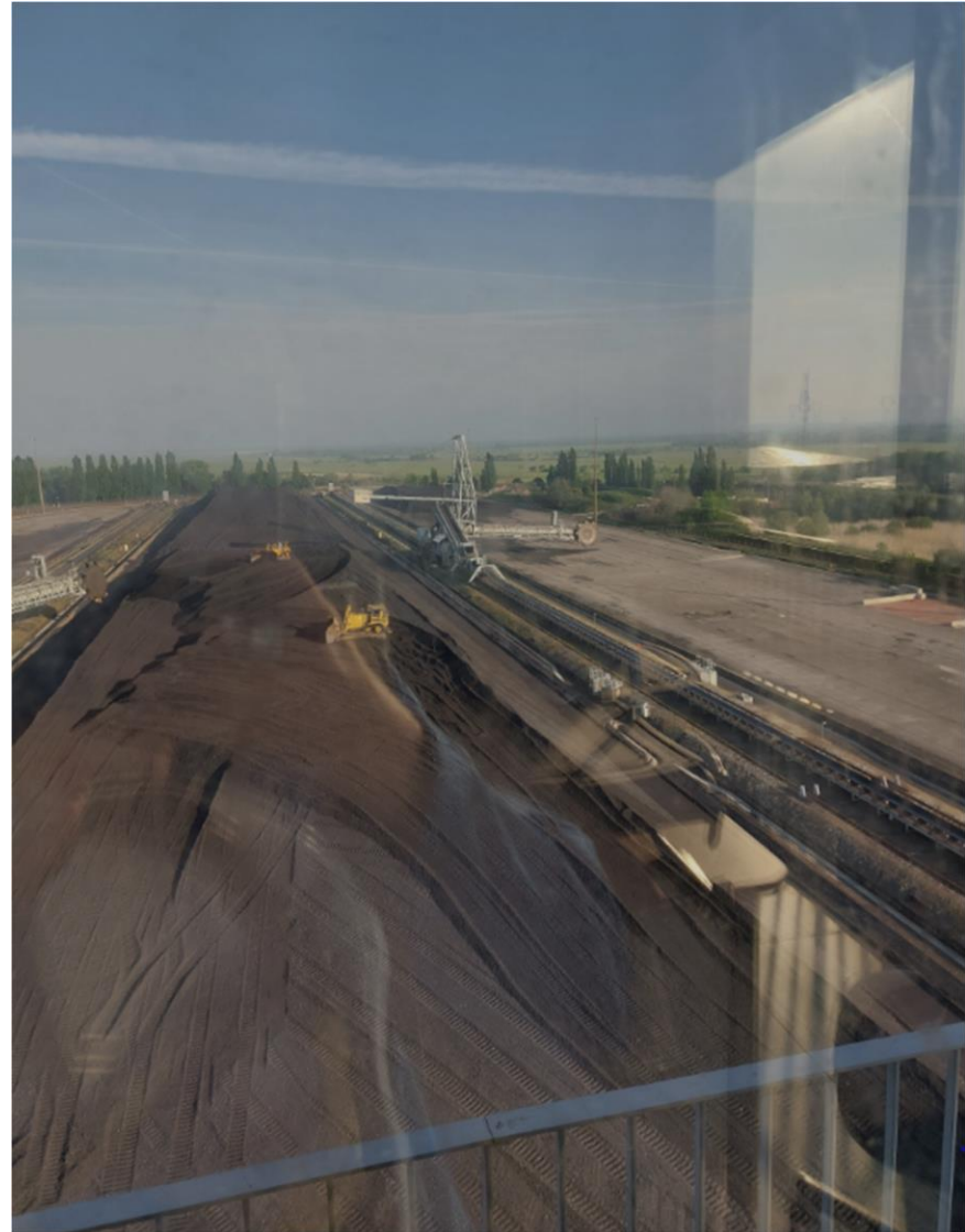
Photographie 3 : Vue du tas B et tas C (zone sans charbon) au 29/04/2022