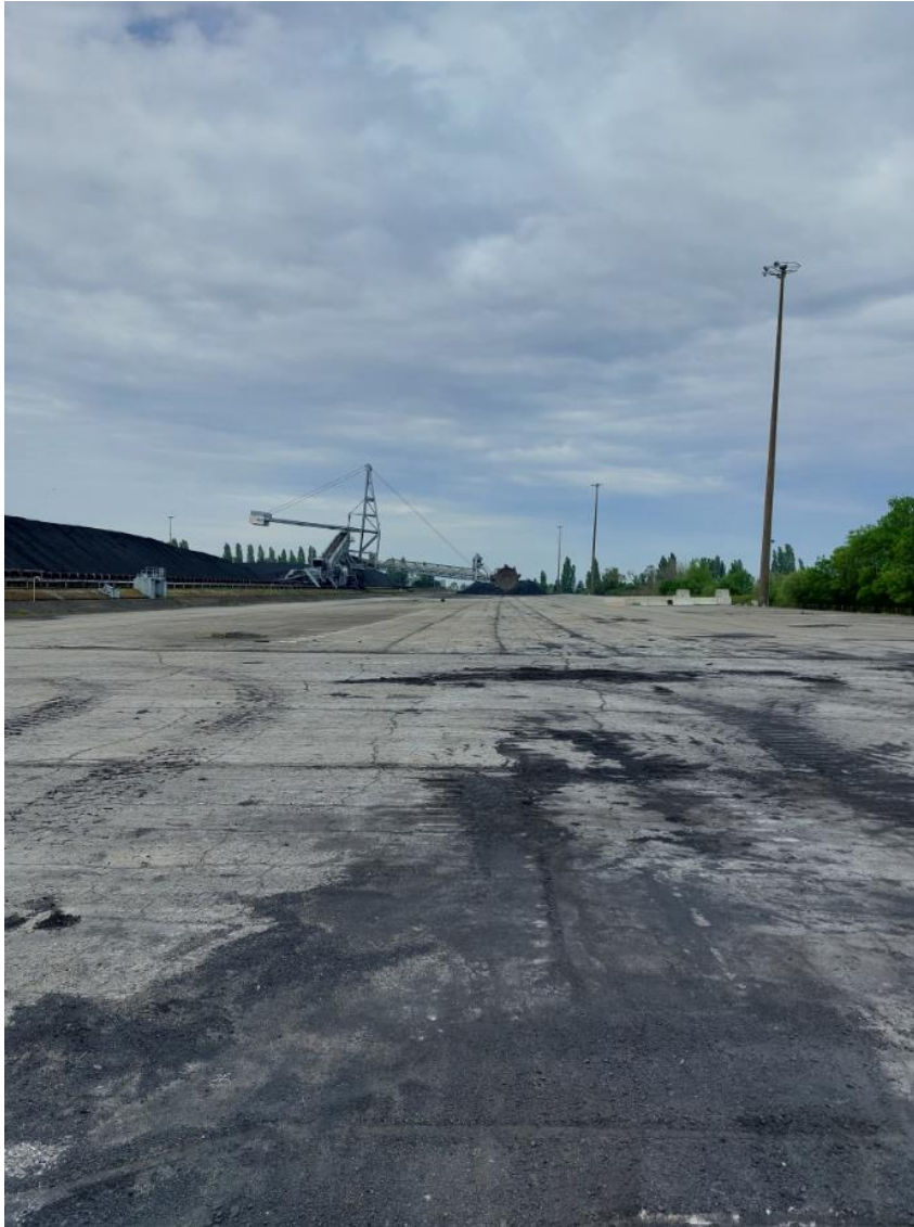
Photographie 2 : Vue du tas C au 29/04/2022