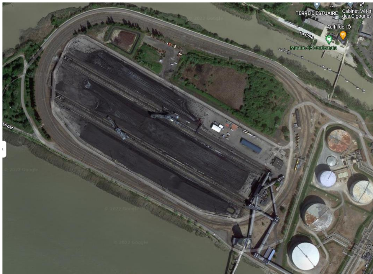
Photographie 1 : Vue aérienne du parc à charbon