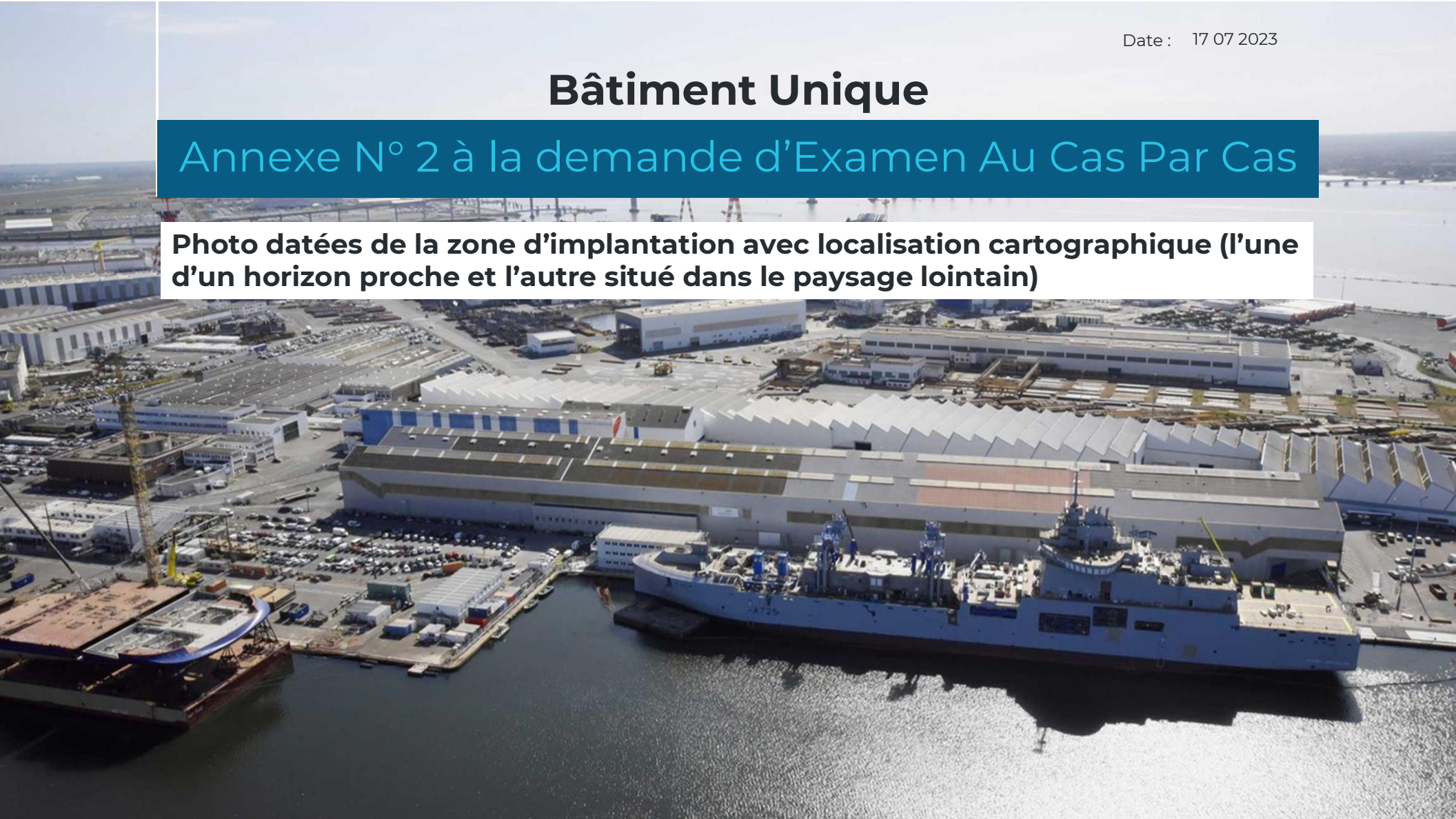
Photo datées de la zone d'implantation avec localisation cartographique (l'une d'un horizon proche et l'autre situé dans le paysage lointain)

Annexe N° 2 à la demande d'Examen Au Cas Par Cas